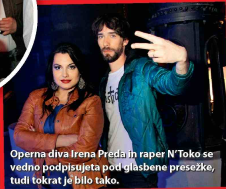
Operna diva Irena Preda in raper N'Toko se vedno podpisujeta pod glasbene presežke, tudi tokrat je bilo tako.